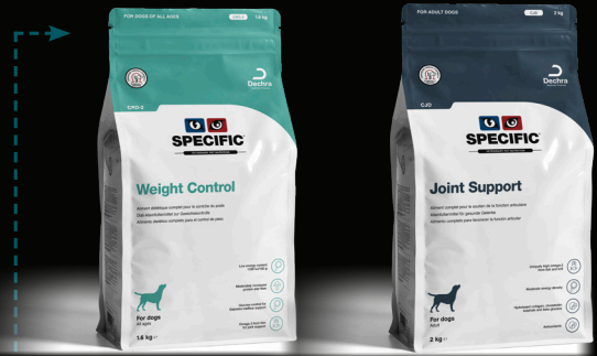
SPECIFIC™ Weight Control CRD-2