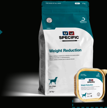
SPECIFIC™ Weight Reduction CRD-1/CRW-1